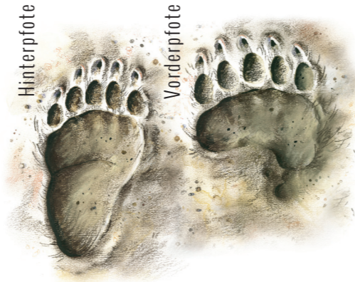
Zeichnung: Igor Pičulin

Wenn man einen Bären trifft, ist es vor allem wichtig, Ruhe zu bewahren und die Vorgangsweise an die jeweilige Situation anzupassen.